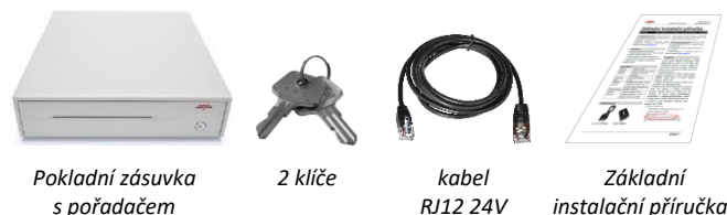
Pokladní zásuvka s pořadačem