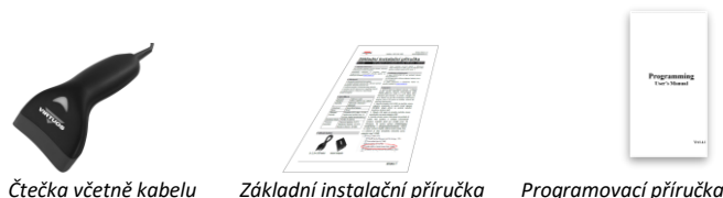
Čtečka včetně kabelu Základní instalační příručka Programovací příručka